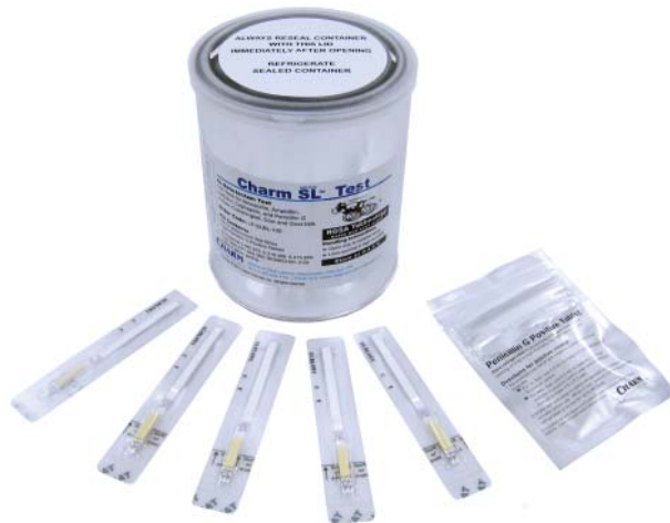
Prueba Charm SL Beta-lactamas